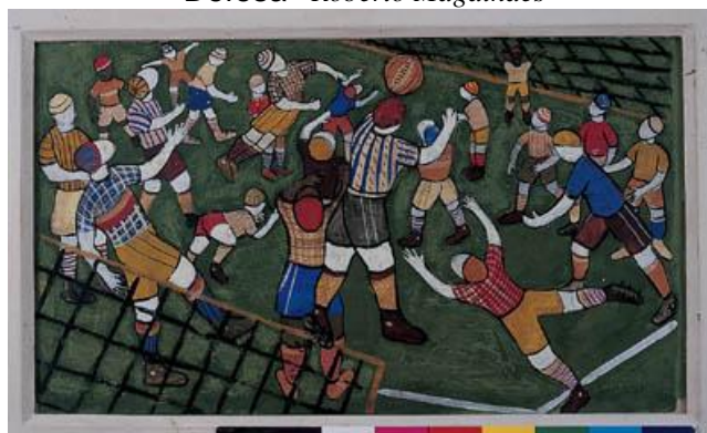
Jogo de bola - Djanira