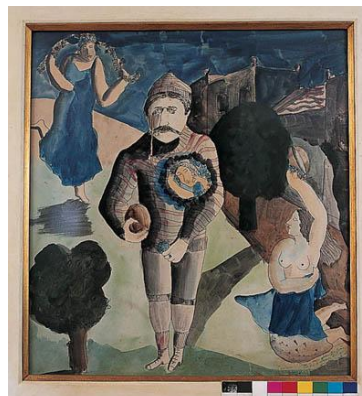
O goleiro - Cícero Dias