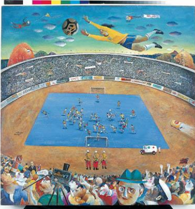
Gol, homenagem a Garrincha - Newton Rezende