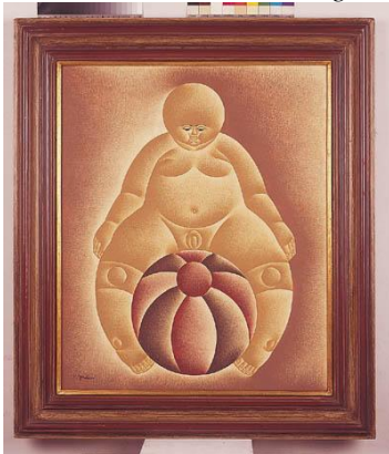
Menino com bola - Vicente do Rego Monteiro