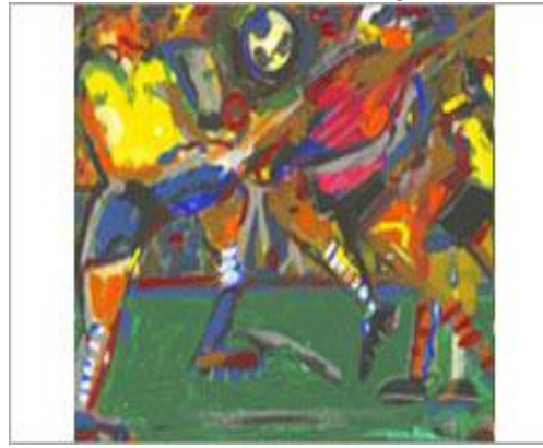
Lance - Ivald Granato

http://www2.uol.com.br/espnbrasil/galerias/2002/03/pele/index.html http://cidadedofutebol.uol.com.br/site/vip/materias/vermaterias.aspx?idm=2074