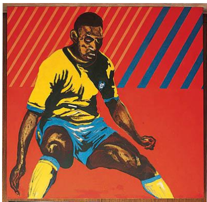
Pelé - Rubens Gerchman