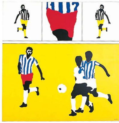
Futebol - Cláudio Tozzi