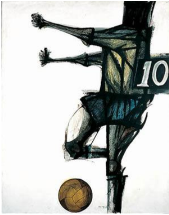
Pelé - Aldemir Martins