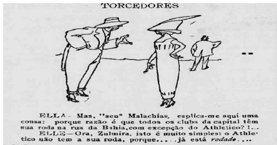
FIGURA 1: Charge publicada no jornal O Foot-Ball , em 21 de setembro de 1917: 1-2.

A presença feminina não era somente notada, mas requisitada por quem organizava o futebol na capital mineira e a imprensa se encarregava de apontar essa importância, tanto em notas nos jornais conforme citado acima, como em charges, vide abaixo.