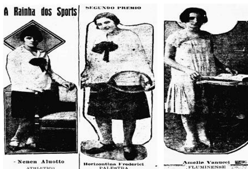
FIGURA 3: Correio Mineiro, 02.04.1927