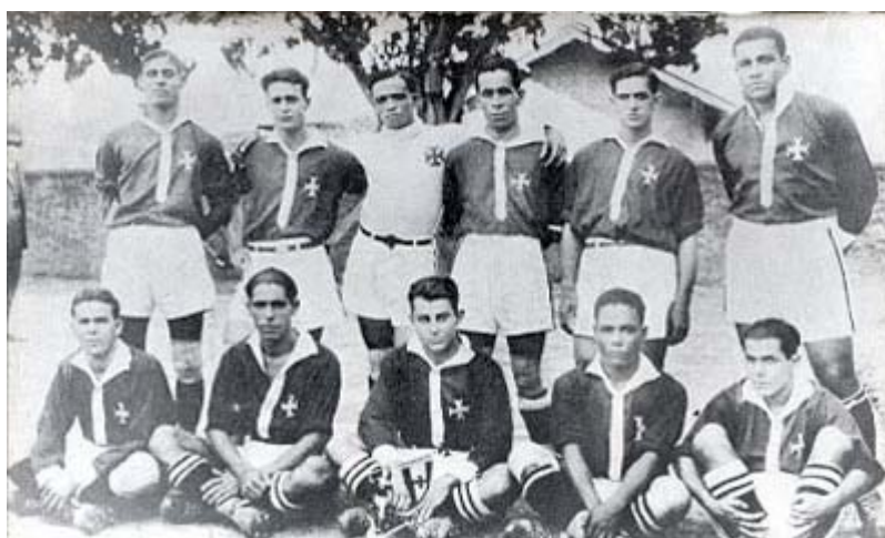
Clube de Regatas Vasco da Gama campeão Carioca de 1923

No início do século XX, o futebol era considerado um esporte das elites. Esta representação era na verdade a representação das classes dominantes. Entretanto, com a vitória do Clube de Regatas Vasco da Gama no campeonato carioca de 1923, os clubes aristocráticos alegaram que os jogadores do Vasco eram profissionais com o intuito de excluí-los do campeonato de 1924. 83