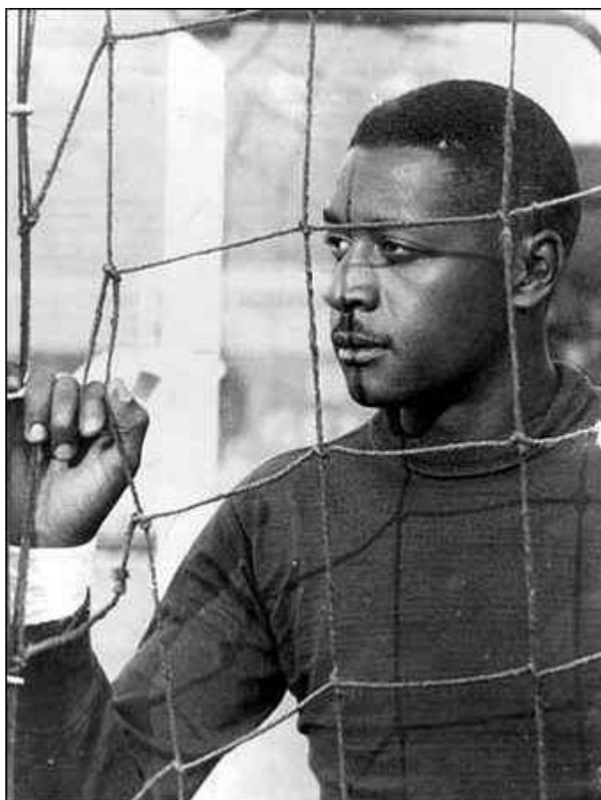
Moacyr Barbosa – Goleiro do Brasil na Copa de 1950

Na Copa do Mundo de 1998, o termo amarelão , foi usado para criticar o jogador Ronaldo após o jogo final. Esta metáfora, estampada na primeira página do jornal O Dia, na manchete: “Ronaldinho amarela antes do jogo e abala a seleção” (O Dia, 13/07/1998:1), foi o dado empírico que me inspirou na análise de outros episódios semelhantes no futebol brasileiro. Verifiquei que já na Copa de 50 alguns jogadores também sofreram críticas pesadas da imprensa. Naquela época os criticados foram Jair da Rosa Pinto, Barbosa e Bigode, além do técnico Flávio Costa.