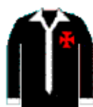
A camisa negra

Ao contratar o técnico uruguaio Ramon Plattero e implementar um regime de treinamento revolucionário para a época, o Vasco construiu uma equipe poderosa, principalmente no aspecto físico. A equipe geralmente perdia o primeiro tempo das partidas, mas no segundo tempo virava o jogo. A condição física dos jogadores ‘camisas negras’, como eram chamados os jogadores do Vasco, era estupenda em relação aos outros jogadores.